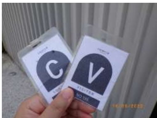
รูปที่ 2-44 บัตรอนุญาตผ่านเข้า-ออกโครงการ