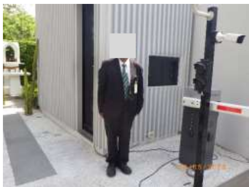
รูปที่ 2-42 เจ้าหน้าที่รักษาความปลอดภัย