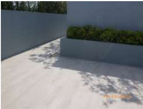
รูปที่ 2-15 ท่อระบายน้ำ