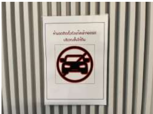
รูปที่ 2-40 ป้าย ห้ามรถติดแก๊สจอดที่ชั้นจอดรถใต้ดิน