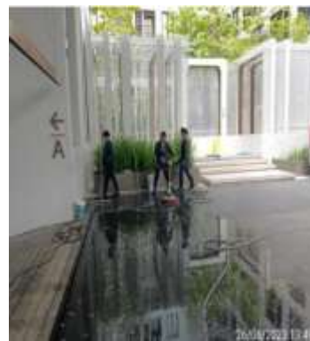
รูปที่ 2-2 พนักงานทำความสะอาด คัดล้างถนน