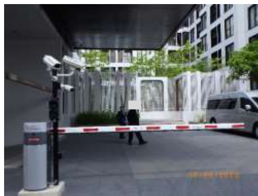
รูปที่ 2-43 ทางเข้า-ออกโครงการ