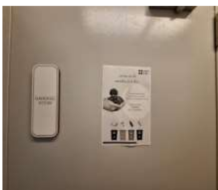
รูปที่ 2-23 ผนังรศัดคัดแยกขยะ