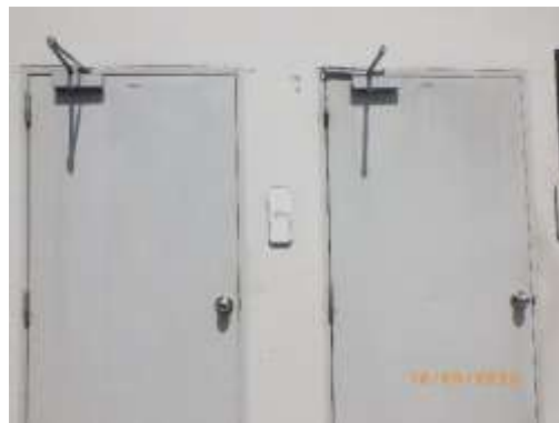
รูปที่ 2-20 ห้องพักมูลฝอยรวม