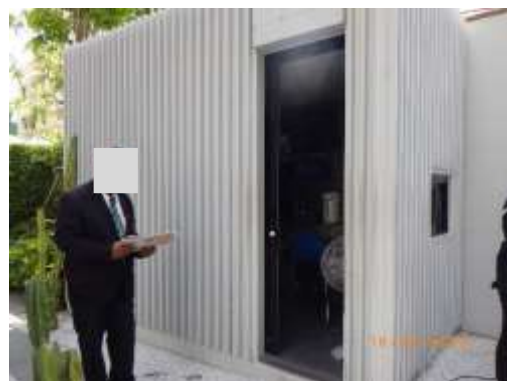
รูปที่ 2-68 ป้อมรปภ.