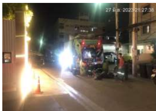
รูปที่ 2-22 รถขนมูลฝอยสำนักงานเขตวัฒนา