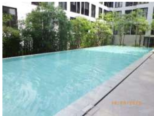
รูปที่ 2-56 สระว่ายน้ำ