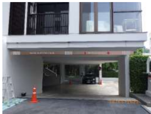
รูปที่ 2-3 ถนนทางเดินรถ และป้ายจราจร