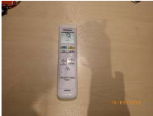
รูปที่ 2-52 ปรับอุณหภูมิที่ 25-26 องศาเซลเซียส