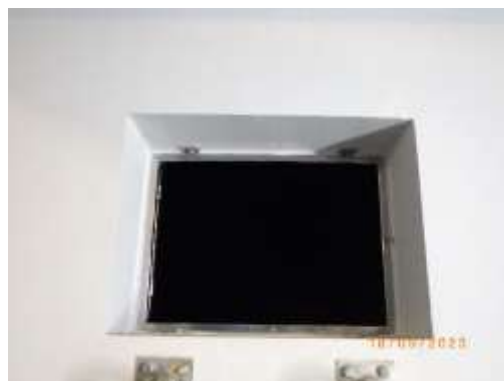
รูปที่ 2-12 ฝาลังเก็บน้ำ