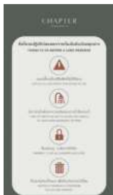
รูปที่ 2-11 รณรงค์ใช้น้ำอย่างประหยัด