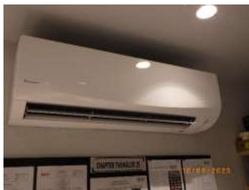
รูปที่ 2-51 อุปกรณ์ไฟฟ้าประหยัดพลังงาน