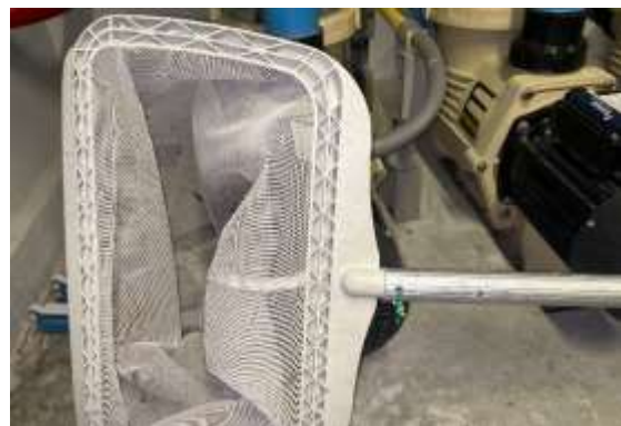
รูปที่ 2-57 อุปกรณ์ทำความสะอาดสระว่ายน้ำ