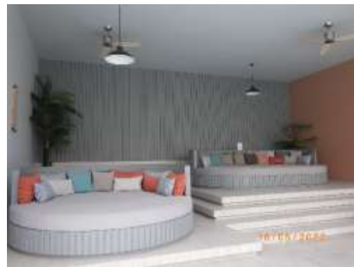
รูปที่ 2-63 ไฟส่องสว่างบริเวณสระว่ายน้ำ