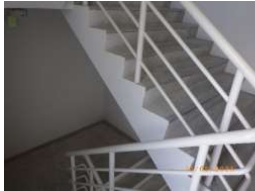
รูปที่ 2-32 บันไดหนีไฟ