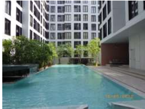
รูปที่ 2-1 ภูมิทัศน์ภายในโครงการ