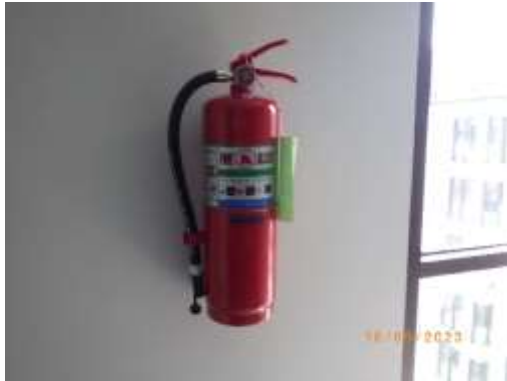
รูปที่ 2-31 ถังดับเพลิง