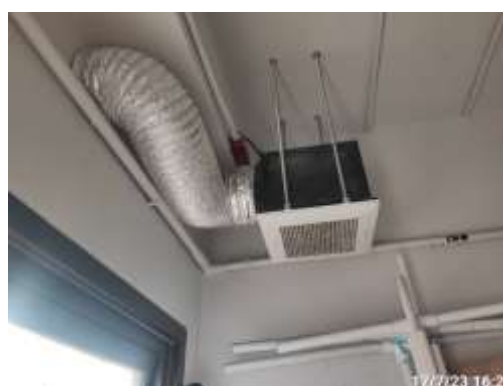
รูปที่ 2-24 ช่องดูดอากาศภายในห้องพักมูลฝอย