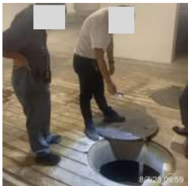
รูปที่ 2-7 เจ้าหน้าที่ดูแลรักษา และควบคุม ระบบภายในโครงการ