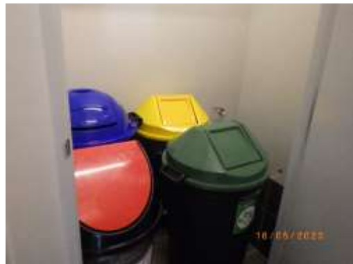
รูปที่ 2-18 ถังรองรับมูลฝอย