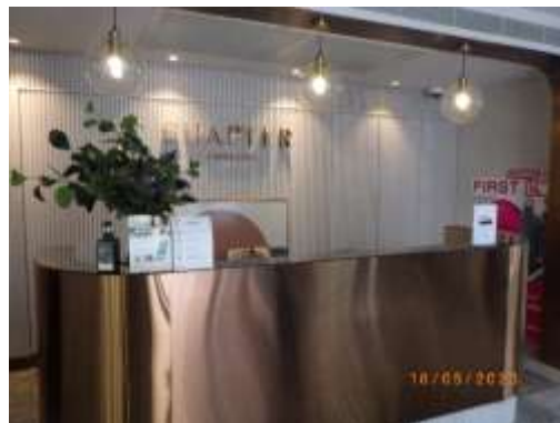
รูปที่ 2-35 ไฟส่องสว่าง