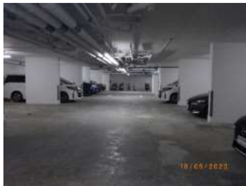
รูปที่ 2-47 ที่จอดรถ