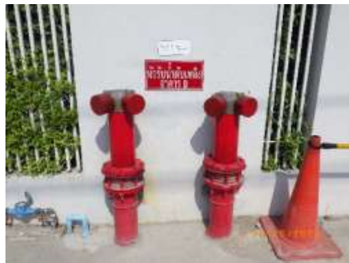
รูปที่ 2-28 หัวรับน้ำดับเพลิงนอกอาคาร 2 จุด