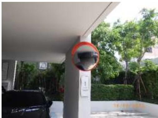
รูปที่ 2-46 กระบอกโค้งจราจร