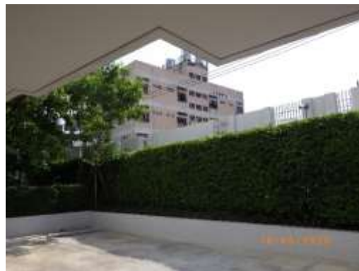
รูปที่ 2-67 รั้วรอบพื้นที่โครงการ