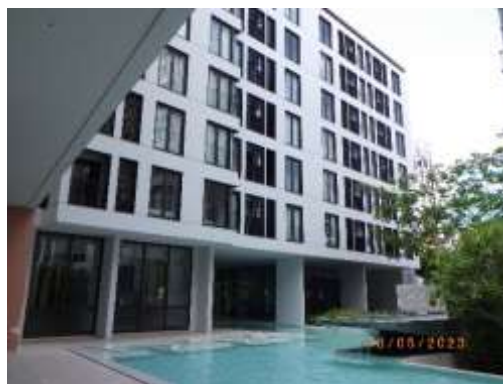
รูปที่ 2-49 กระบอกห้องพักแบบรับแสงธรรมชาติ