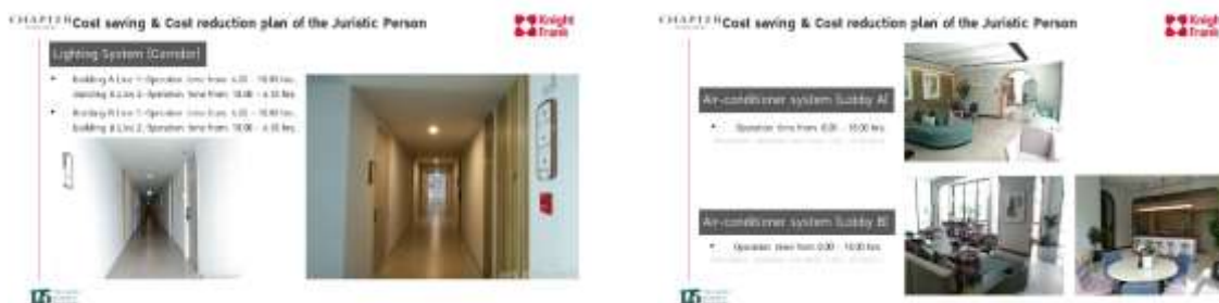
รูปที่ 2-25 รณรงค์ใช้ไฟฟ้าอย่างประหยัด