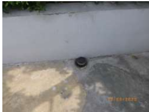
รูปที่ 2-16 ตะแกรงดักขยะ