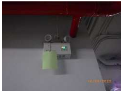
รูปที่ 2-33 ไฟฉุกเฉิน