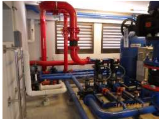
รูปที่ 2-27 ระบบจ่ายน้ำดับเพลิง