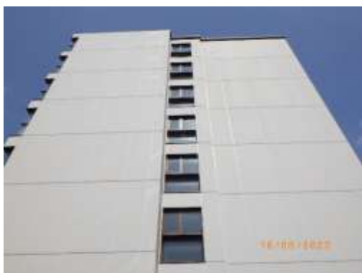
รูปที่ 2-50 ระบบระบายอากาศที่ตัวอาคาร