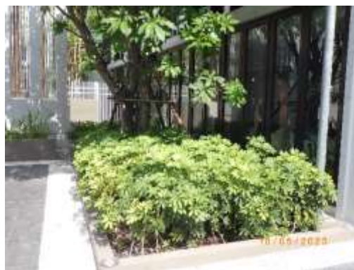
รูปที่ 2-5 พื้นที่สีเขียว