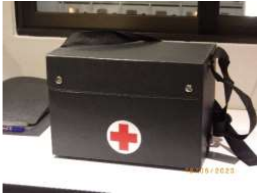
รูปที่ 2-65 ชุดปฐมพยาบาล