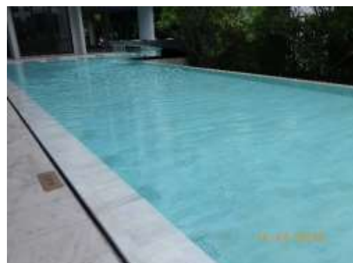
รูปที่ 2-61 รางระบายน้ำล้น