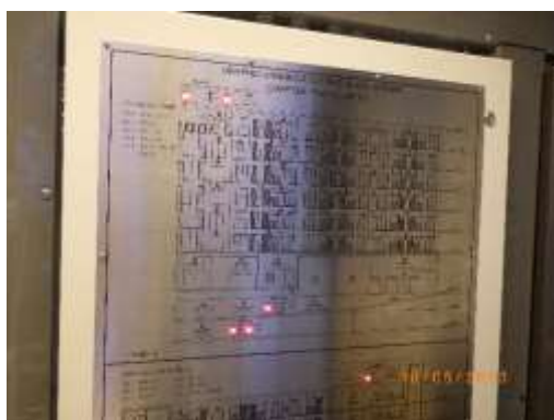
แผงควบคุมระบบแจ้งเหตุอัคคีภัย