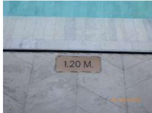
รูปที่ 2-62 ป้ายบอกความลึก