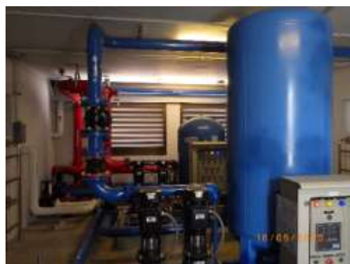
รูปที่ 2-10 ถังเก็บน้ำคาดฟ้า