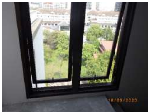
รูปที่ 2-41 ช่องระบายอากาศบริเวณบันไดหนีไฟ