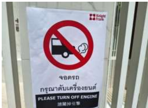
รูปที่ 2-4 ป้ายห้ามติดเครื่องยนต์ทิ้งไว้