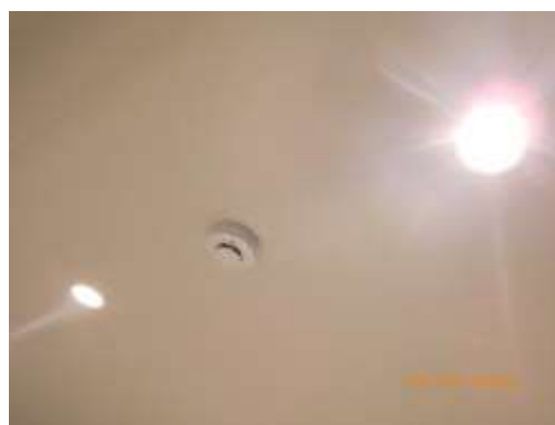
เครื่องตรวจจับควัน และความร้อน