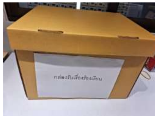
รูปที่ 2-69 กล่องรับเรื่องร้องเรียน