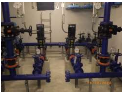
รูปที่ 2-9 ถังเก็บน้ำใต้ดิน