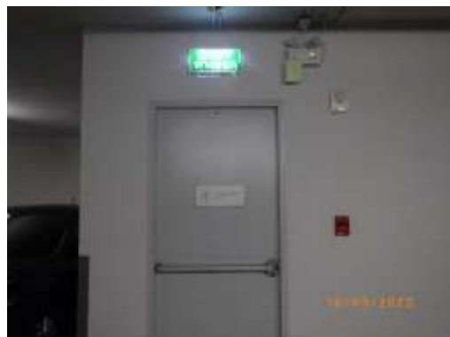
รูปที่ 2-34 ป้ายบอกทางหนีไฟ