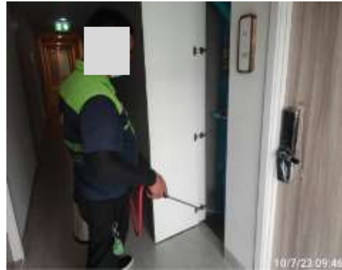
รูปที่ 2-55 ทำลายแหล่งเพาะพันธุ์พาหะนำโรค