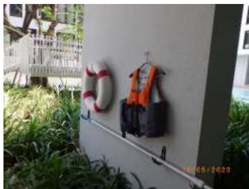
รูปที่ 2-64 อุปกรณ์ช่วยชีวิตบริเวณสระว่ายน้ำ