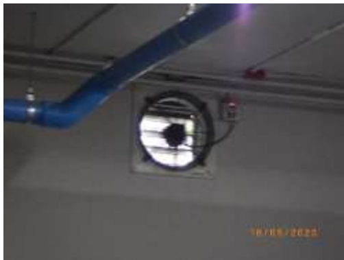
รูปที่ 2-54 ระบบระบายอากาศจากชั้นจอดรถ