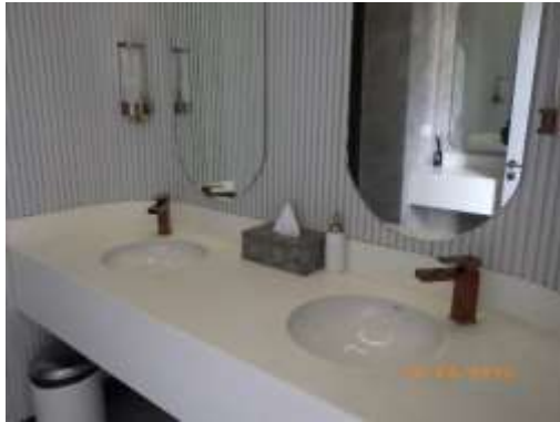
อ่างล้างมือ