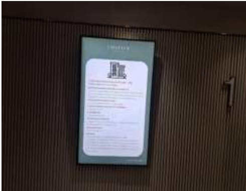
รูปที่ 2-13 ประชาสัมพันธ์หน้าโครงการ