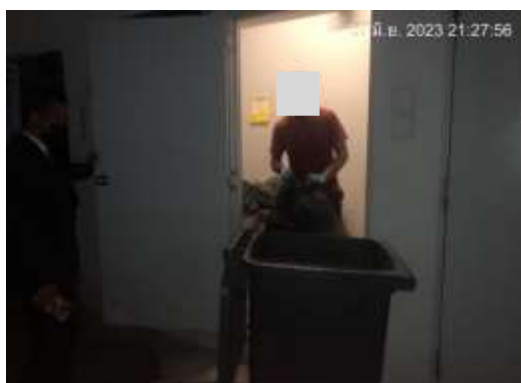
รูปที่ 2-21 พนักงานทำความสะอาด และจัดเก็บมูลฝอย