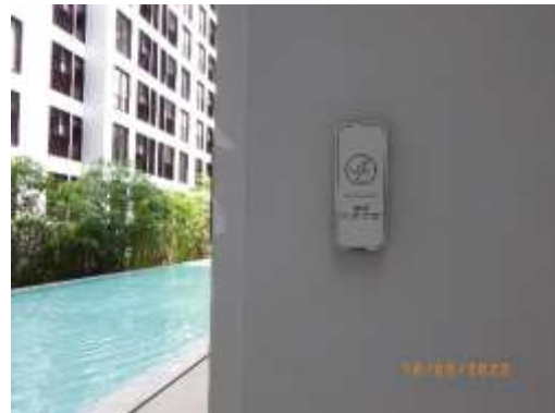
รูปที่ 2-59 ป้ายแสดงข้อปฏิบัติสำหรับผู้ใช้บริการสระว่ายน้ำ