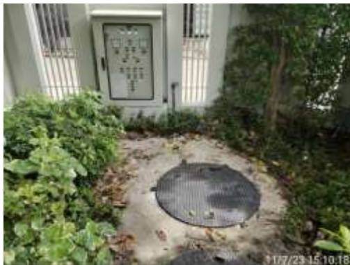
รูปที่ 2-17 บ่อหน่วงน้ำ