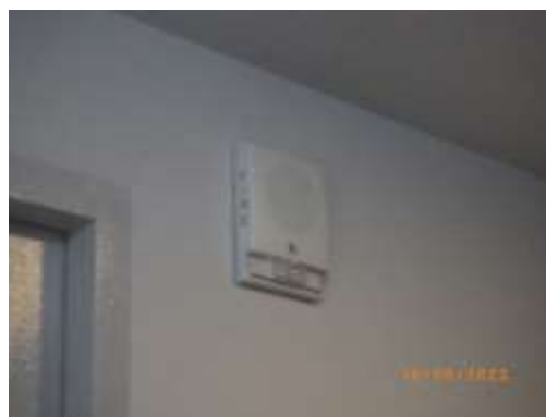
อุปกรณ์ส่งเสียงแบบกริ่งสัญญาณ