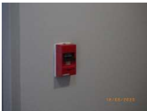
ปุ่มแจ้งสัญญาณอัคคีภัย