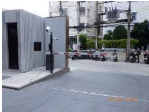
รูปที่ 2-53 กล้องวงจรปิดภายใน และภายนอกโครงการ