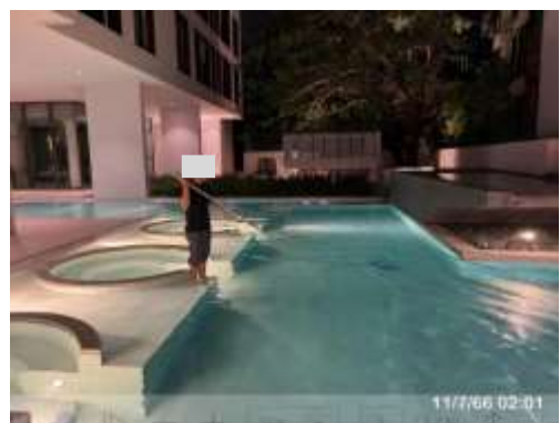
รูปที่ 2-60 เจ้าหน้าที่ทำความสะอาดบริเวณสระว่ายน้ำ