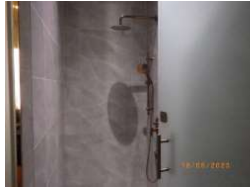
ห้องน้ำ และห้องเปลี่ยนเสื้อผ้า