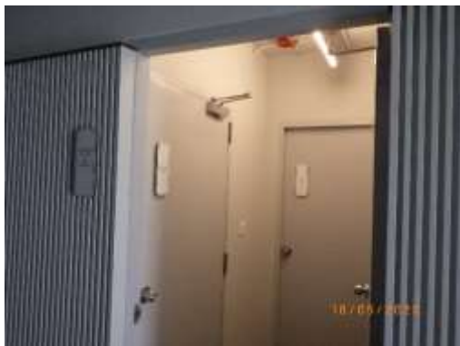
รูปที่ 2-19 ห้องพักมูลฝอยประจำชั้น