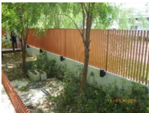
รูปที่ 2-48 ไฟส่องสว่างรอบพื้นที่โครงการ