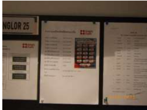
รูปที่ 2-66 เบอร์ฉุกเฉิน